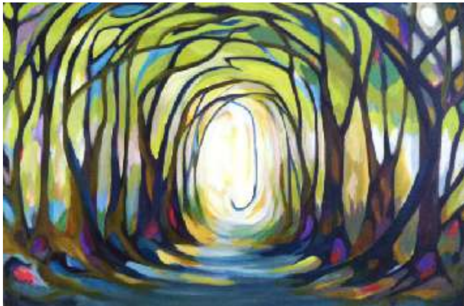
Ch. Hutson. Light. Tree tunnel